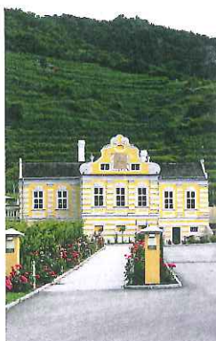
Kellerschlössel, het 'gele kasteeltje'